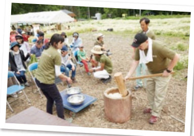
つきたての「カミツレ餅」に「カミツレきな粉」を添えて皆さまに。使用したもち米は、カミミールを栽培したあとの畑を田んぼにして育てたお米、通称「カミツレ米」