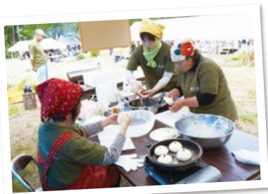
地元、広津自治会の皆様による伝統的で昔ながらの「灰焼きおやき」ワークショップ