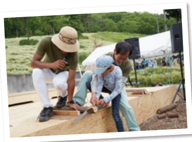
お子様や女性も参戦して、大いに盛り上がった「丸太早切り大会」