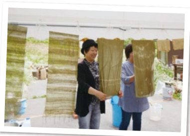
シルクのスカーフをカミミールで自然な風合いに染める染色体験