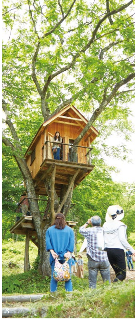
1. テラスや踊り場のアイアンの柵はカミツレの葉がモチーフに 2. 部屋の広さは2〜3畳ほど。大人向けだからインテリアもシックでお洒落に 3. カミツレ畑の中、里を一望できる最高のロケーション